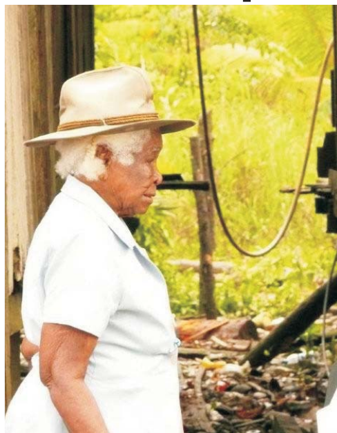
Acción Social está presente en Antioquia a través de 30 programas, en los cuales se

han invertido más de mil millones de pesos. Entre los programas más destacados se encuentran Familias en Acción, Atención a Víctimas de la Violencia, Atención a Población Desplazada, Generación de Ingresos, Donaciones, Mejoramiento de Habitabilidad, Mujeres Ahorradoras, Protección de Tierras, Infraestructura y Familias Guardabosques.